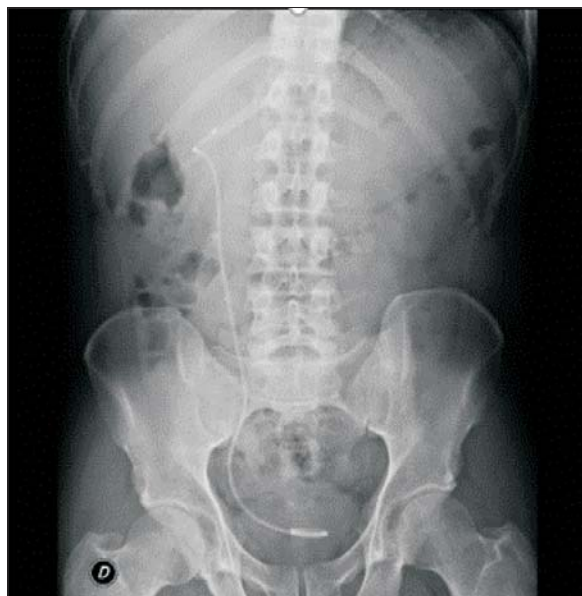
Figura 1. Radiografía de abdomen. Catéter doble J en riñón derecho.

A las ocho horas posteriores al procedimiento de LEOC, instala vómitos incoercibles y dolor abdominal a predominio de hemiabdomen superior, sin fiebre. Se solicitó paraclínica de valoración general que evidenció hiperleucocitosis de 19.270 u/L y amilasemia de 579 U/l; se le realizó una tomografía de abdomen que evidenció: alteraciones de la grasa peripancreática, escasa cantidad de líquido a nivel del espacio perigastroduodenal y escaso líquido libre intraabdominal; el sector cefalopancreático se observó levemente aumentado de tamaño con densidad heterogénea y se observó el catéter doble J normo posicionado a derecha. A las 48 horas, el paciente incrementó los síntomas de intolerancia digestiva, agregó distensión abdominal difusa e intensificó el dolor abdominal. En las siguientes horas instaló polipnea, taquicardia sinusal y fiebre. Se solicitó nueva paraclínica de la que se destaca una amilasemia de 1.047 U/l, proteína C reactiva (PCR) de 196 mg/l, hematocrito (HTO) de 48%, hiperleucocitosis de 21.300 \mu L, hiperazoemia 1,48 g/l con creatininemia de 2,24 mg/dl, funcional y enzimograma hepáticos normales. Se repitió la tomografía