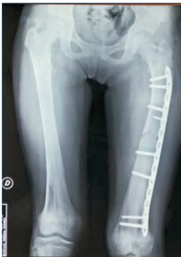
Figura 4. Radiografía control tres meses posoperatorio donde se visualiza consolidación ósea. Se presenta sin dolor y se indica apoyo total, luego de haber realizado su recuperación con muletas y apoyo parcial progresivo.