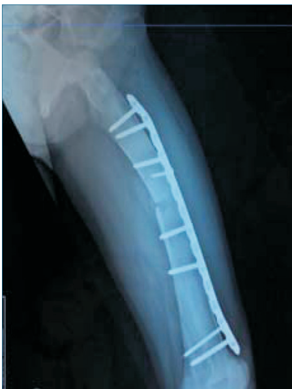
Figura 2. Control posoperatorio inmediato donde se observa una buena reducción de la fractura.

peroné izquierdos, así como el fémur y tibia derechos. Se destaca, a su vez, cartilagos de crecimiento abiertos en ambos húmeros, tibias y fémures.