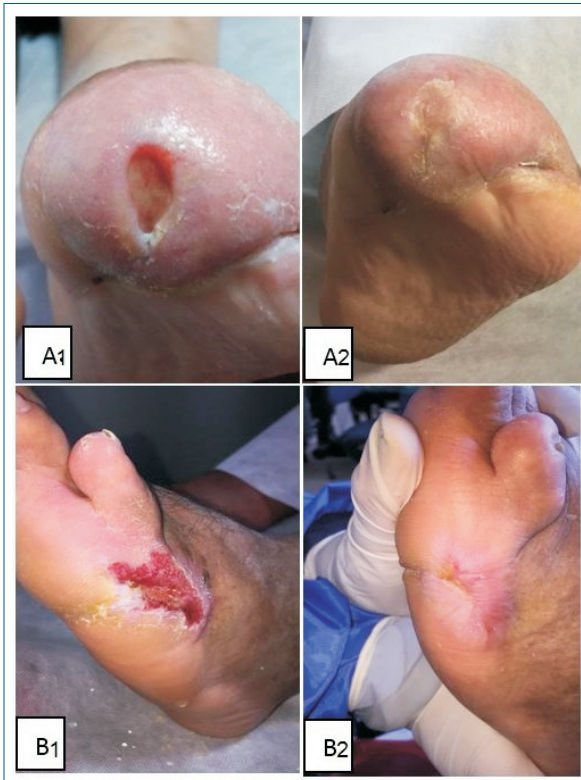
Figura 5. Pacientes representativos. (A1) Estado inicial, úlcera Wagner grado II sobre cicatriz de amputación transmetatarsiana (A2), úlcera completamente curada (día 90). (B1) Estado inicial, úlcera Wagner II del lecho de amputación en rayo del quinto dedo. (B2) Úlcera completamente curada (día 90).

mente la proliferación de fibroblastos y la expresión de colágeno tipo I (39) , estimula la granulación, la angiogénesis y la proliferación celular, promoviendo la reepitelización (40) .