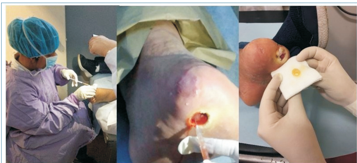
Figura 2. Aplicación del PRP. Inyección en bordes de úlcera y aplicación de gel en forma de coágulo. Pacientes con úlceras Wagner III.

vio a cada aplicación de PRP. La longitud máxima y el ancho de cada herida se determinaron usando una regla esterilizada, se realizaron dos medidas y la media se utilizó para el cálculo. Se registró el área de la úlcera en \text{cm}^2 mediante Mobile Wound Analyzer (MOWA), software de análisis de imágenes de úlceras (figura 3). Se calculó el porcentaje de reducción de la úlcera utilizando la fórmula: