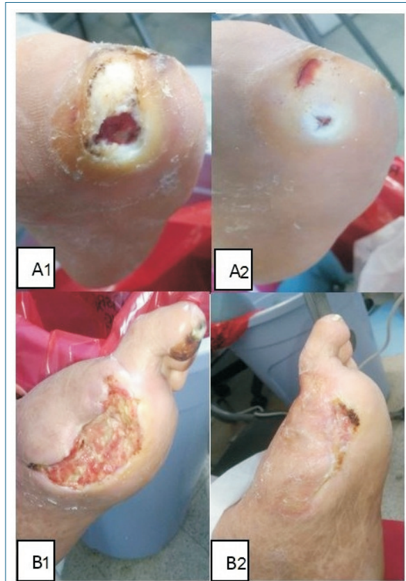
Figura 6. Pacientes representativos. (A1) Estado inicial, úlcera Wagner grado 3 sobre tercer radio del metatarsiano, en cicatriz de amputación transmetatarsiana. (A2) Úlcera cicatrizada en 99% (día 90). (B1) Estado inicial, úlcera Wagner grado 3 del lecho de amputación en rayo del primer dedo. (B2) Se logró una reepitelización significativa en 99% (día 90).

Un estudio que evaluó el tratamiento durante 12 semanas con PRP (aplicado dos veces por semana) demostró que es más efectivo en términos de año de vida gana-