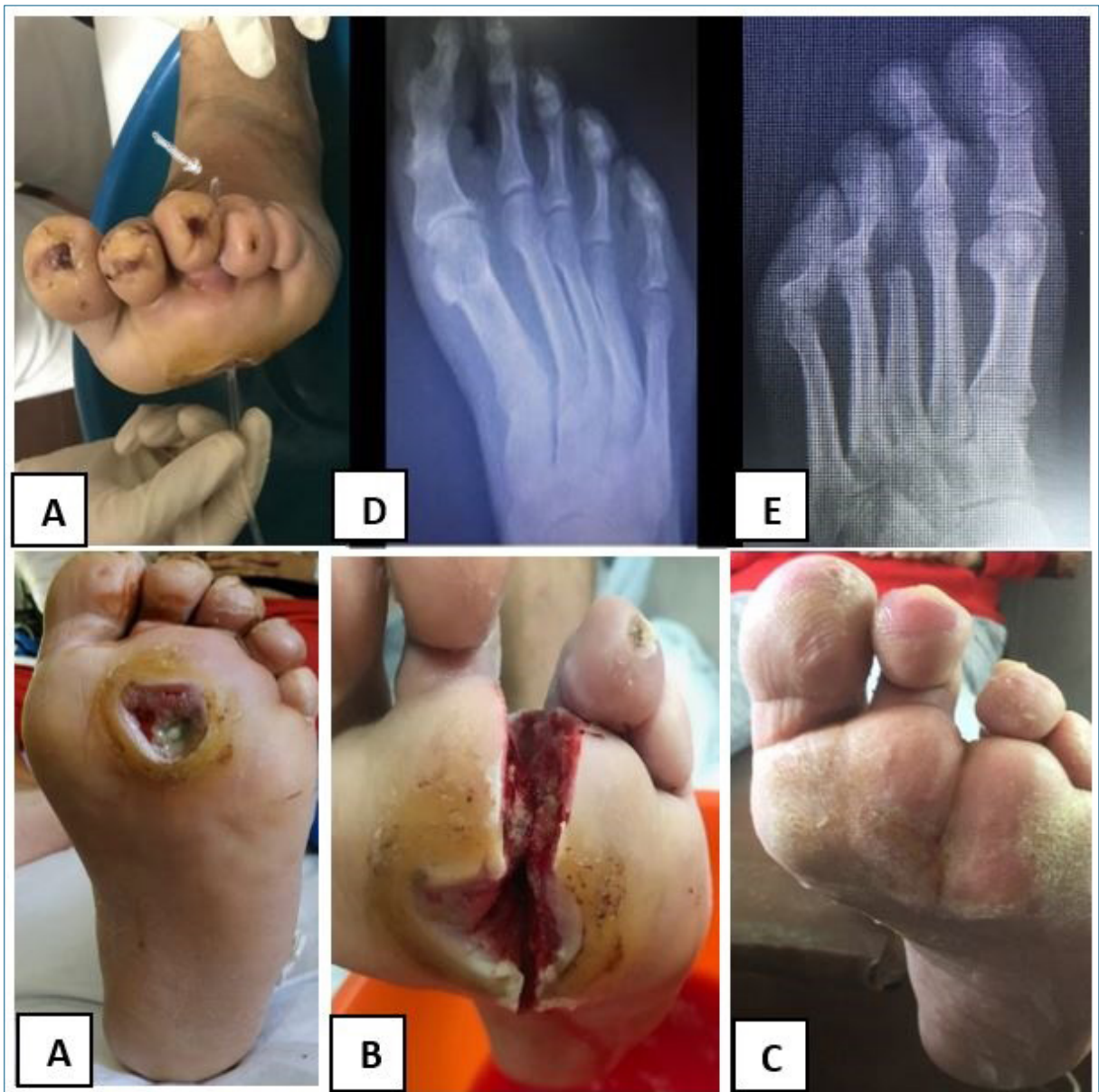
Figura 3. Paciente 6. A) UPD sobre la cabeza del tercer metatarsiano >1 cm 2 , exposición ósea, fistulización a dorso. B) Resección de la cabeza del tercer metatarsiano por abordaje plantar. Ulcerectomía. Exposición de la cabeza metatarsiana. Desbridamiento de tejidos blandos Resección de la tercera cabeza junto a las falanges. C) Cierre de la herida por segunda intención a las 10 semanas. D) Radiografía preoperatoria. E) Radiografía al año.

tico que la OM del medio pie y del retropié. Cuando la infección de tejidos blandos se propaga rápidamente y se localiza en la parte media o posterior, la cirugía suele ser mandatoria. Otro paciente presentó infección compleja dle talón con OM. El Doppler arterial mostró buen flujo sanguíneo en la arteria tibial posterior, se realizó una necrectomía y remoción de fragmentos óseos en el block quirúrgico sin amputación. Se continuó con tratamiento ATB durante 6 semanas dirigido al germen cultivado y desbridamientos frecuentes, lo-