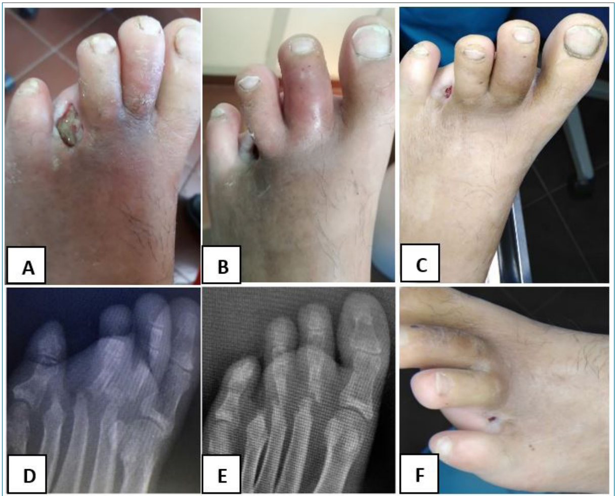
Figura 2. Paciente 5. A) Pie izquierdo. UPD postquirúrgica, 30 días de evolución postamputación del cuarto dedo, rubor de segundo y tercer dedo. B) Segundo dedo "en salchicha" con edema y rubor dorsal, 60 días postamputación del cuarto dedo. C) Reducción de signos inflamatorios y del diámetro de la úlcera luego de 5 semanas de tratamiento ATB. D) Rx, osteólisis de la cabeza del segundo y tercer metatarsiano, con luxación de la articulación metatarsofalángica, 60 días postamputación del cuarto dedo (la RM muestra artritis con osteomielitis). E) Rx: lesiones estables a los 12 meses. F) Sin elementos de infección de partes blandas. Leucocitos y PCR normales a los 12 meses.

inicial o contiguo evaluado al menos un año después del final del tratamiento ATB. Se solicitó el consentimiento informado firmado por los pacientes para la divulgación científica de los casos.