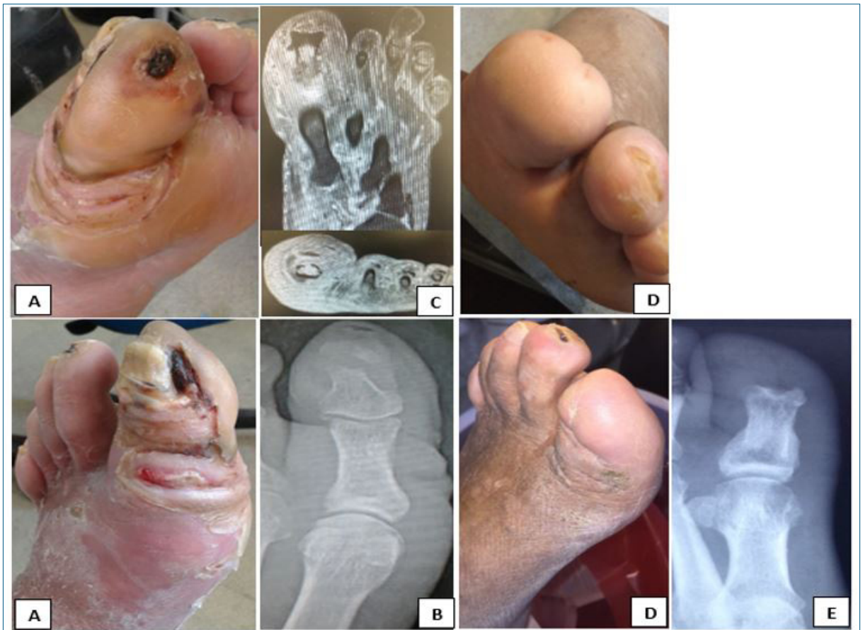
Figura 4. Paciente 1. A) Úlcera plantar del hallux con flemón del dedo y cara interna del antepié. B) Rx: interrupción de cortical y osteopenia de falange distal. C) RM corte axial y coronal: edema medular, destrucción de la cortical dorsal, sinovitis, edema de partes blandas. D) Falangectomía distal por abordaje dorsal, cicatrización a los 3 meses, visión plantar y dorsal. E) Rx posterior.

características de la lesión, más aun teniendo en cuenta los escasos estudios prospectivos controlados que lo avalan (7) .