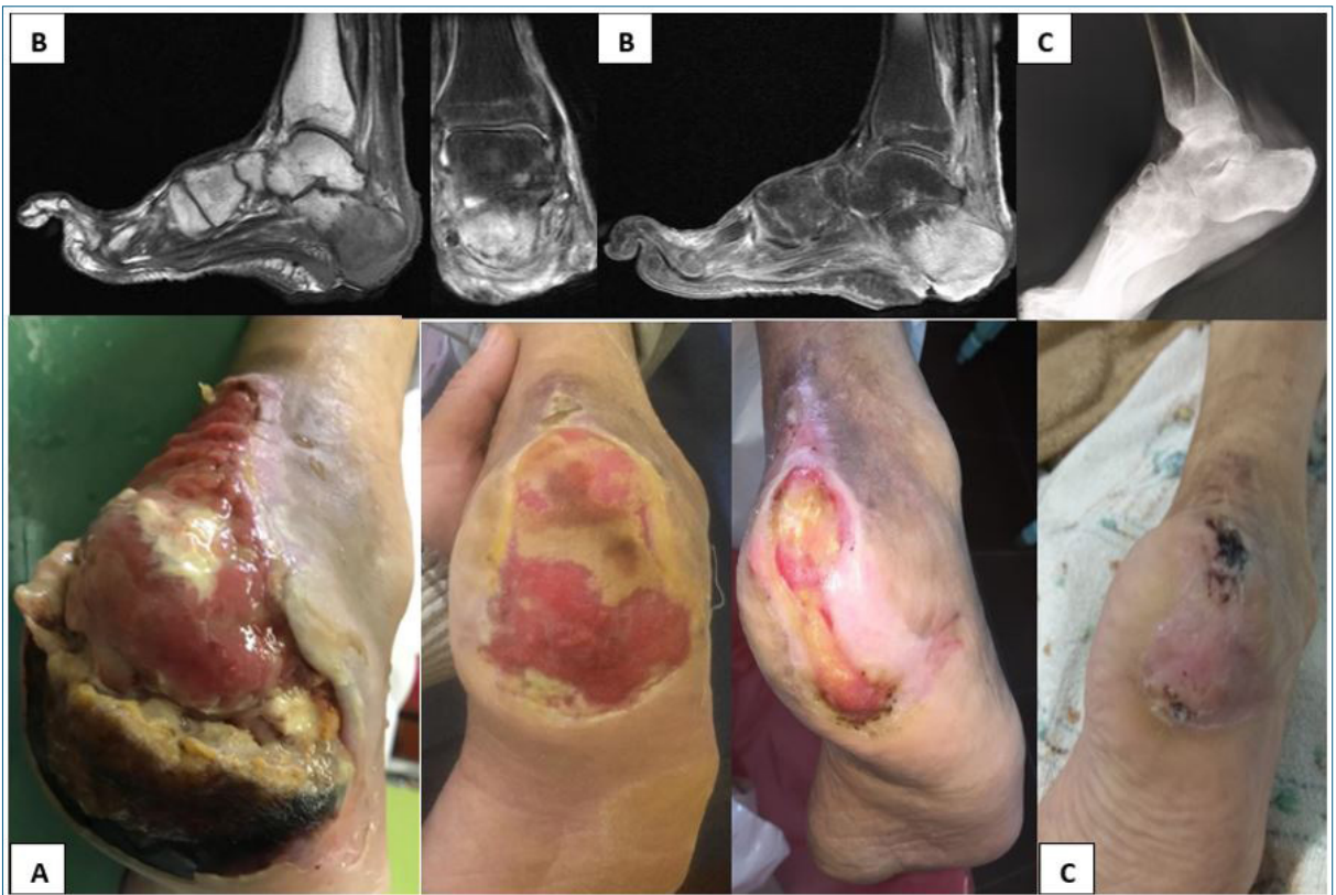
Figura 1. Paciente 2. A) Úlcera de Wagner* III-IV. Necrosis de la almohadilla plantar, pie derecho. B) Resonancia magnética. Cortes sagitales y coronales ponderados T1 con contraste: pérdida tegumentaria, edema de todos los planos, grasa de Kagger y tejido celular subcutáneo posterior. Edema del calcáneo en sector plantar y posterior que se refuerza con el contraste. En bloc quirúrgico, resección de partes blandas y restos óseos. Cicatrización al año. C) Rx a los dos años. Escoriaciones en talón por apoyo a los 2 años. Se confeccionan plantillas de descarga personalizadas.

* Wagner FW. The dysvascular foot: a system for diagnosis and treatment. Foot Ankle 1981:264-122.